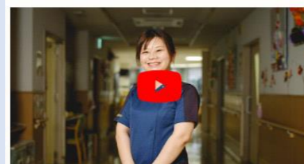
KAIGO SWITCH Vol.8 岡の苑

KAIGO SWITCH (カイゴスイッチ) は、大分県介護現場革新推進事業が、「介護テクノロジー」を中心に、「ノーリフティングケア」など進化する大分県の介護に関する情報をお届けする Web サイトです。